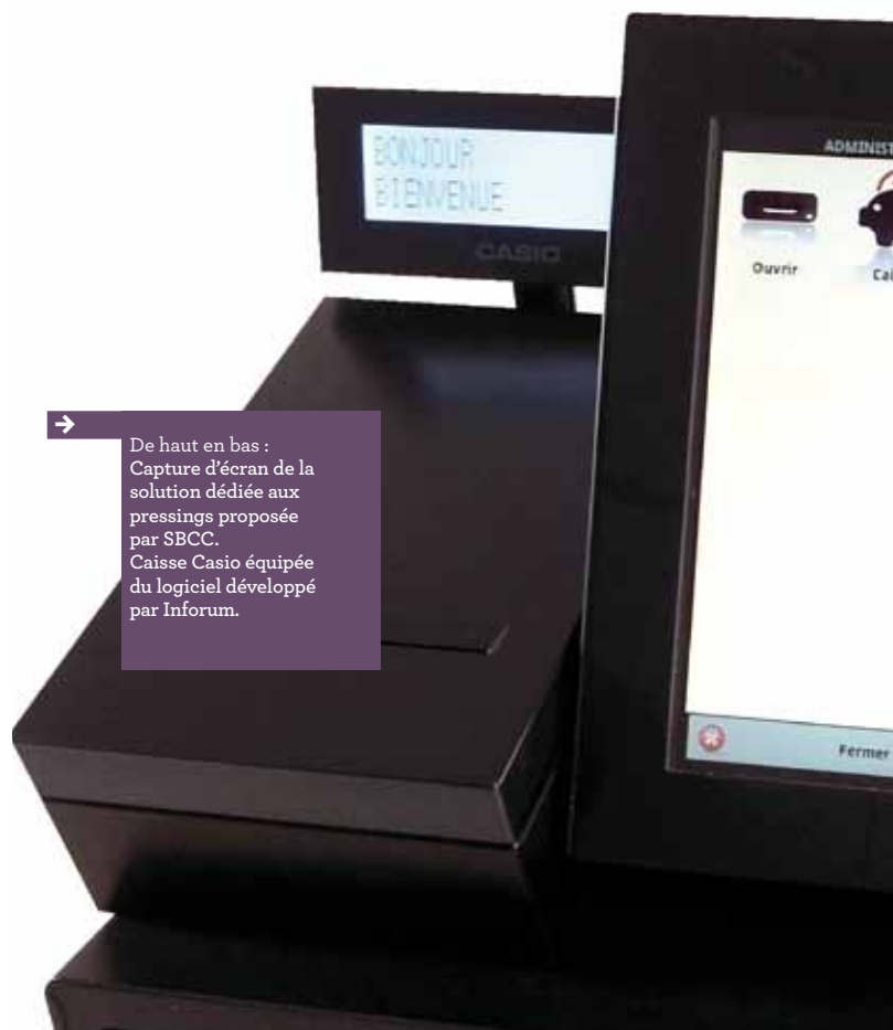
De haut en bas : Capture d'écran de la solution dédiée aux pressings proposée par SBCC. Caisse Casio équipée du logiciel développé par Inforum.

Finalement, si on ne devait retenir qu'un conseil pour bien choisir dans l'océan de caisses enregistreuses ou de logiciels de caisse qui pullulent sur le marché, ce serait de se pencher sur le sujet d'une manière très précise, et de s'appuyer sur les conseils